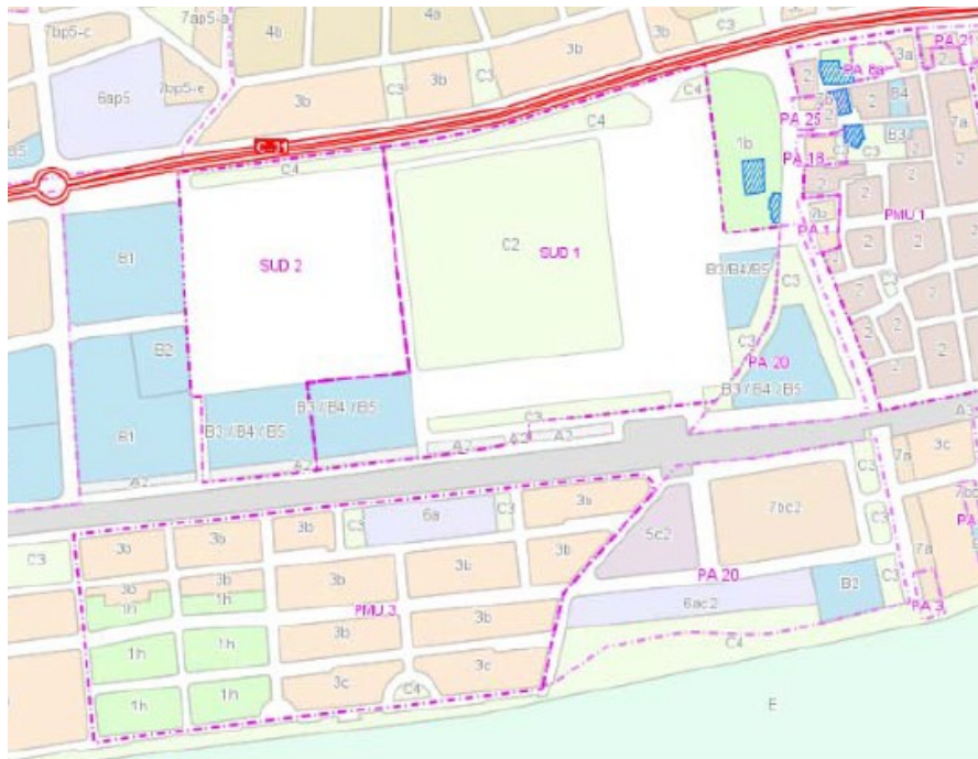
Plana del Castell

Al mateix costat d'aquest terreny trobem dues peces més formen part d'aquest espai que actualment estan pendents d'urbanitzar zones residencials el sector SUD 1 i el sol urbà PA-20, que formen la Plana del Castell, que es un zona de desembocadura de la riera de Cunit i d'aiguamolls i per tant inundable.